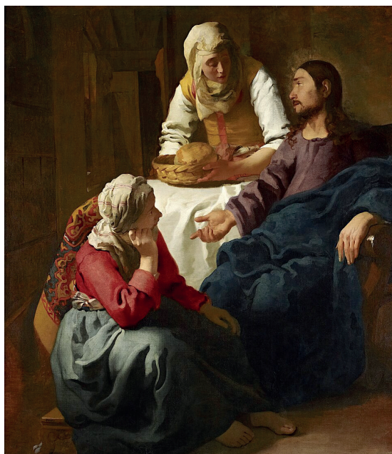
Cristo nella casa di Marta e Maria, Jan Vermeer, prima del 1654-1655, olio su tela (National Gallery of Scotland, Edimburgo) - Maria è seduta ai piedi di Gesù